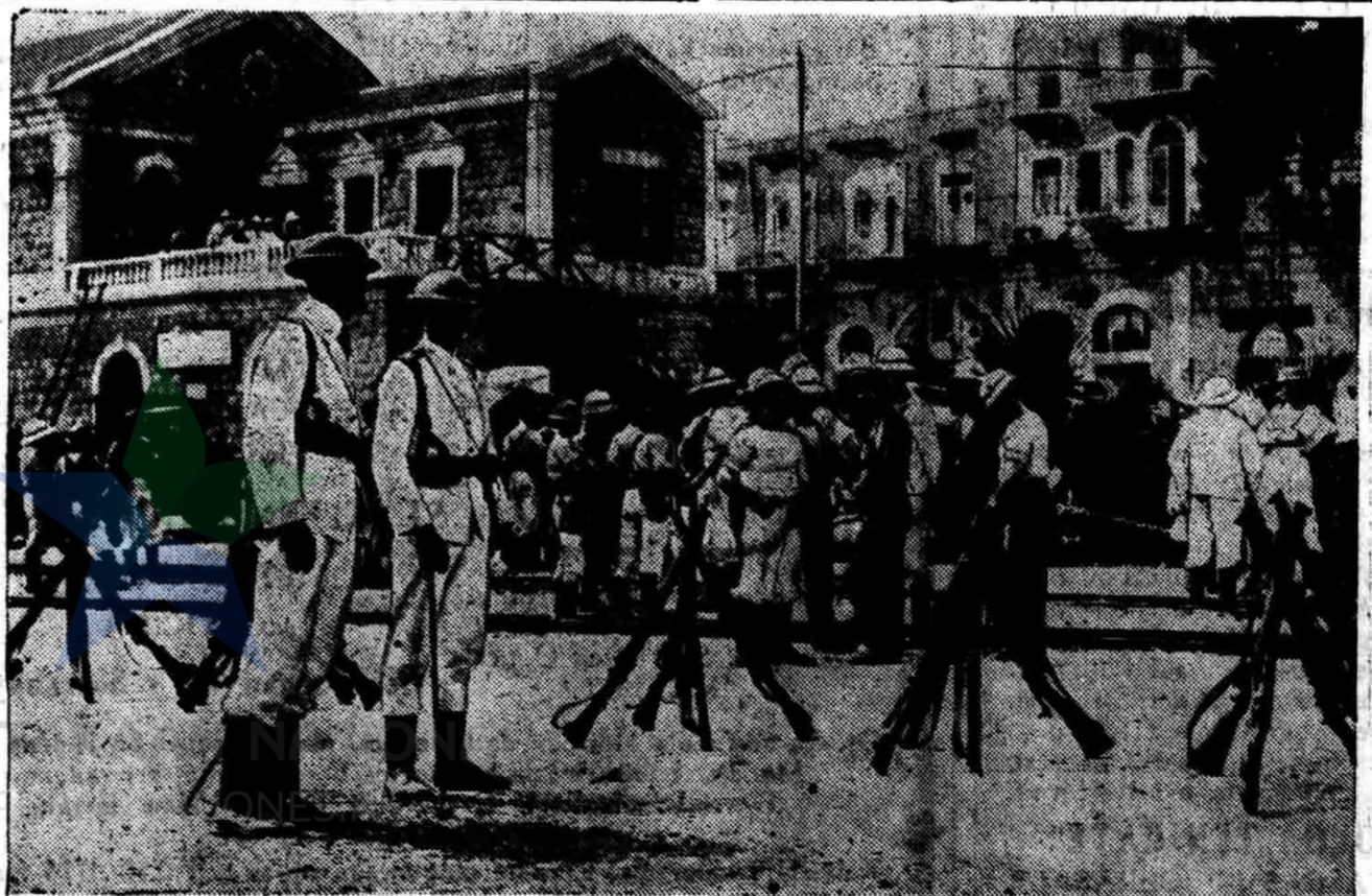
Diatas ini gambar barisan Inggeris jang menjaga keamanan di Haifa, Palestina.